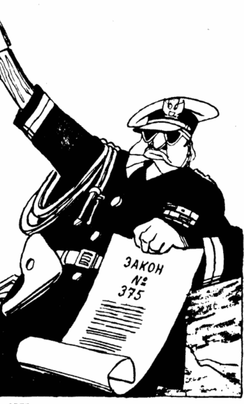
Фемиды образца 1959 года