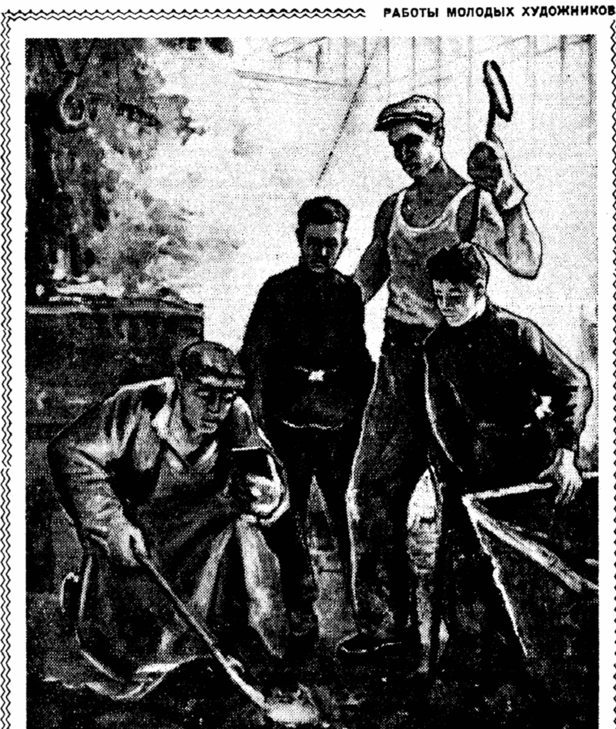
Уже несколько дней в Московском государственном художественном институте имени В. И. Сурикова идет защита дипломных работ. Молодые художники, побывавшие на стройках семилетки...

Экспозиция вновь открытого павильона книги будет периодически изменяться — ведь каждый день обогащает книжный рынок новинками.