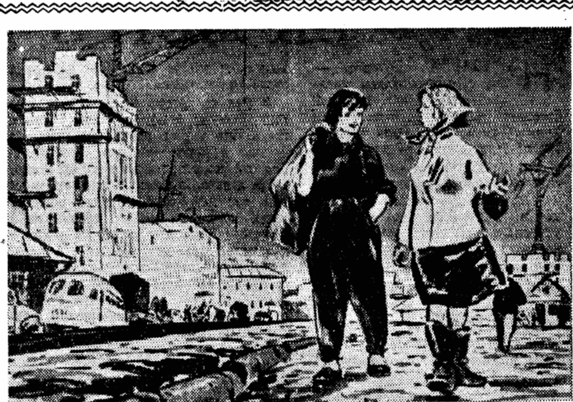
И. Прагер, Подруки (Литография)