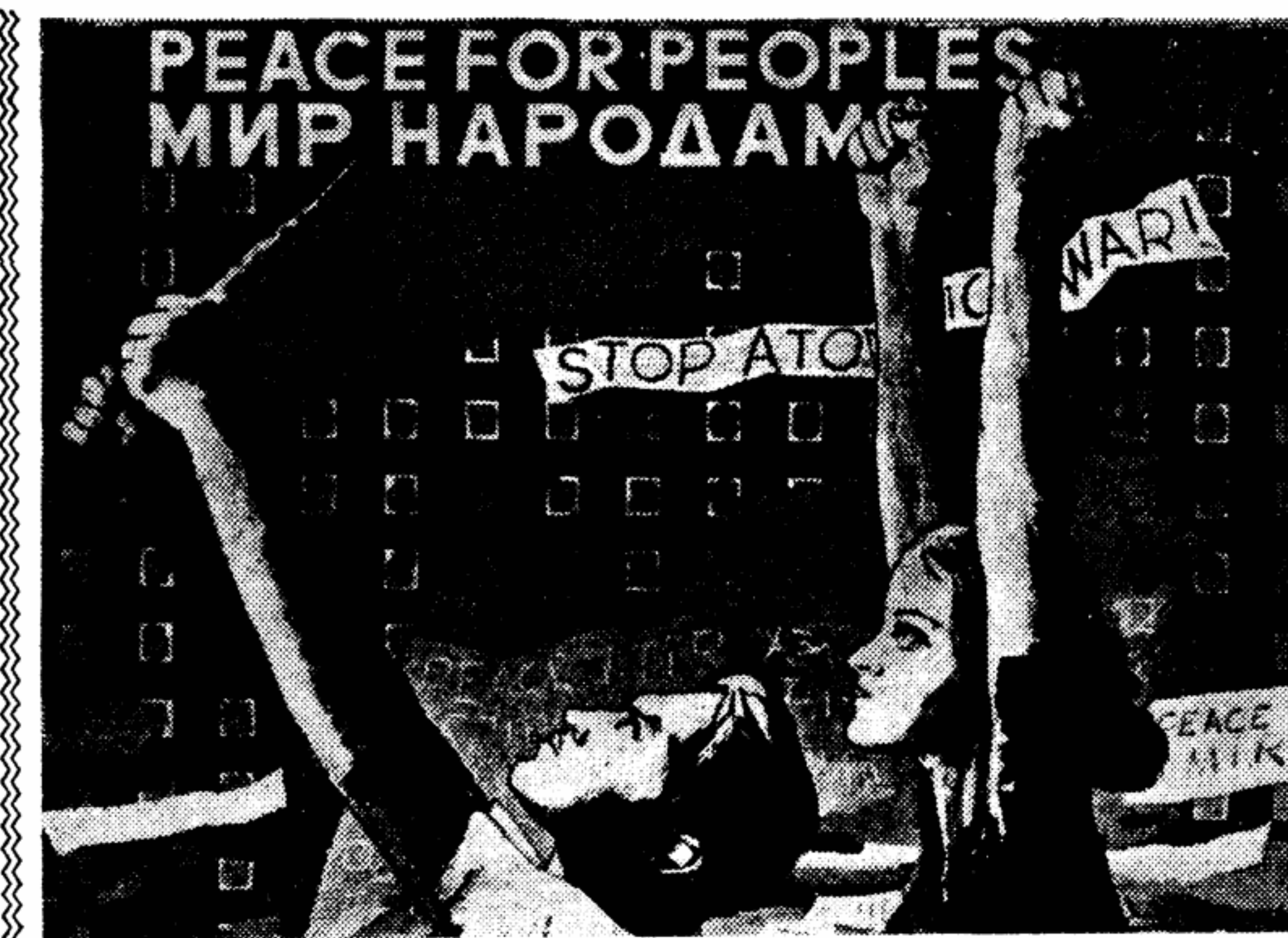
Н. Аleshин. «Мир народам» (Плакат).