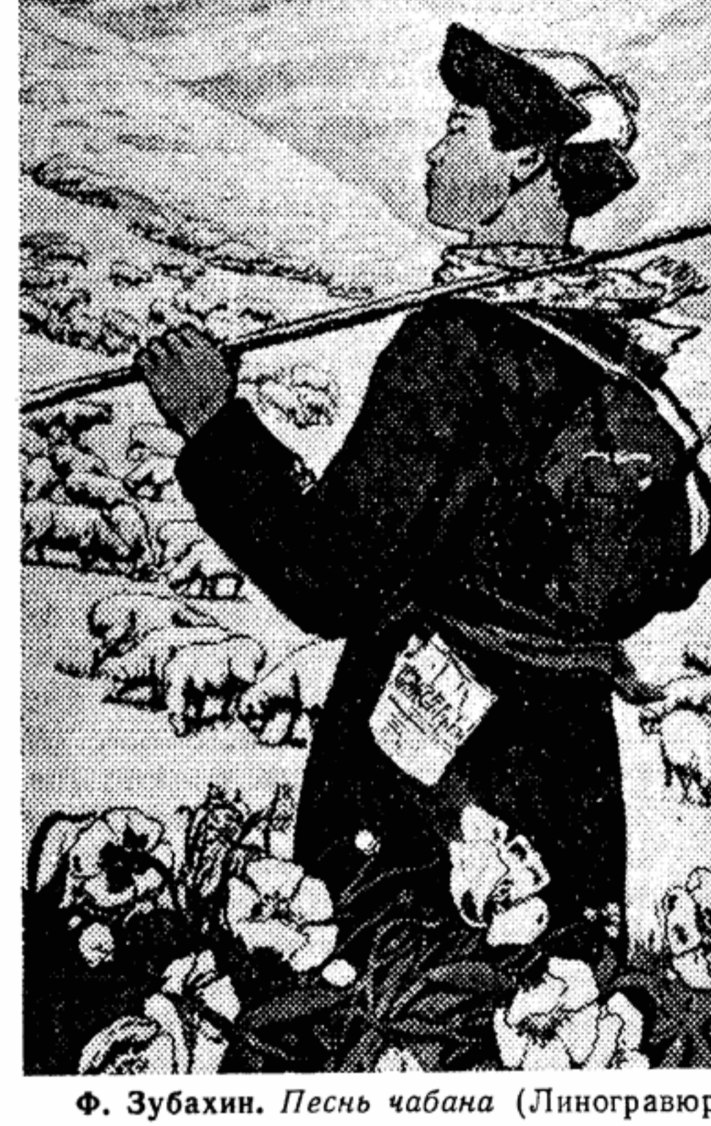
Ф. Зубахин. Песнь чабана (Лингограф).